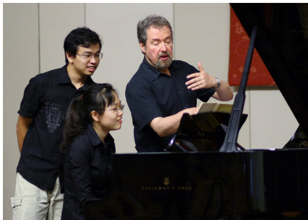
志愿者为公开大师班进行翻译

北京国际音乐大师班艺术节组委会 活动官方网站： www.bimfa.org/cn