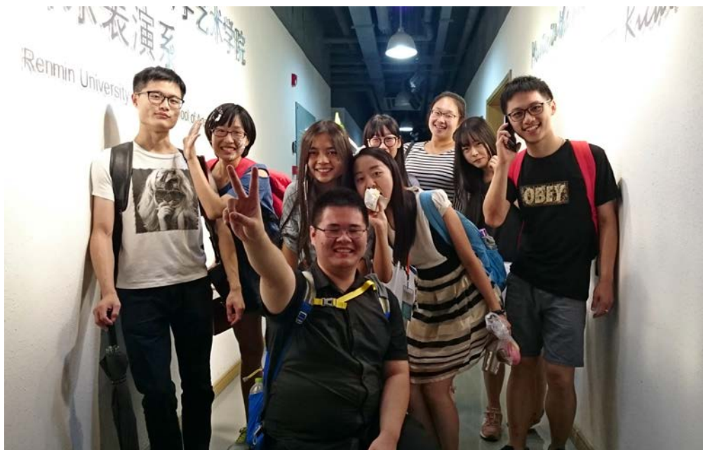
北京国际音乐大师班艺术节部分实习生、志愿者合影